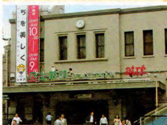
田中氏も「上野は午前中から飲める居酒屋があり、タクシーで5分ほどの場所に湯島、鶯谷のラブホ街もあってオススメ」と太鼓判、行くっきゃない!

「勝負時は朝。早朝バスで到着したコは暇つぶしに困っていることが多いので成功率が高い。あと、外国系イベント時に若い女子が集まる代々木公園も狙い目ですね」 GWの鉄板スポット「夢の王国」の最寄り