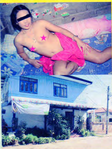
ウドンタニの風俗店にいる女のコの半数は10代で、残りも20代前半が大半。料金は300バーツ(約1000円)と破格

海外風俗情報誌「アジア天王」編集長。アジア各地を飛び回り、風俗を中心とした最新事情に精通する。各地域の夜遊びガイドブックの出版も手掛けている