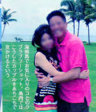
海南島でお気に入りのコとのラブフォトセッション。島内ではこうしたカッパルをあちこちで見かけるという

なくとも10回以上は通ったという。「取引先の社長に誘われてゴルフをしに行ったのがきっかけです。20代前半の女性キャディーがついたんですが、社長が『このコ、夜のエスコートもOKだから』って言うんです。いやあ、それですっかりハマっちゃって。今は日本に戻りましたが、それでも連休に有休を組み合わせたりにして休みを取っては通っちゃっています(苦笑)」。KTVはもちろん、「桑拿」と