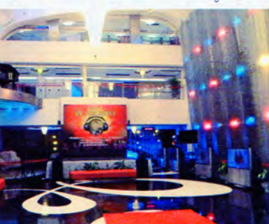
KTVの入り口ホール。専業のコもいるが、昼間はOLや販売員など本業を持つコも多いとのこと

よく連れていったりしますね」 KTVには多数の女性が在籍しており、連れ出しOKの店も多い。相場は店や女のコのグレードによって大きく異なるが、高級店では一晩が10000~20000円(=約1万60000~3万20000円)。安い店なら6000円(=約9600円)といったところ。 「KTVでは日本じゃ絶対に抱けないレベルのコに出会えます。さらに深圳には安い風俗もたくさんあります」 なかでも特に「穴場」だと松田さんが語るのが散髪屋。日本の理