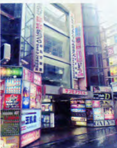
サラリーマンが行き交う京橋のサンピアザビル付近では、多くのピンサロ店がしのぎを削っている

3店をはしこしても1万円以内で収まる格安っぷりながら、色気のある人妻が多く、関西の風俗好きは足繁く通っているとのことだ。