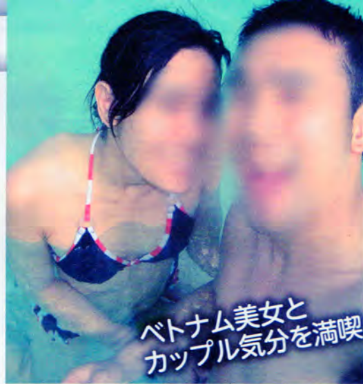
ベトナム美女とカップル気分を満喫

して注目を集めるのがブンタウだ。「恐らく、名前すら聞いたことがない人が大半だと思いますが、ブンタウは南シナ海の海底油田の前線基地になっているオイルマネー街。カネの集まるにはオンナも集まるってわけです」