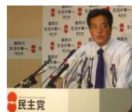
民主党 揺れる政治 ついに政権交代