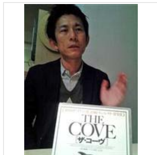
イルカ漁糾弾映画「ザ・コーヴ」配給会社社長は「あれもプロパガンダ、反論の映画を